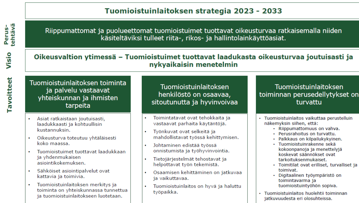
Kuva 1. Tuomioistuinlaitoksen strategia 2023–2033

Toiminta- ja taloussuunnittelu perustuu tuomioistuinlaitoksen strategiaan ja siinä asetettuihin tavoitteisiin. Suunnitelmassa on huomioitu Tuomioistuinviraston johtokunnan hyväksymät tuomioistuinlaitoksen keskeiset tavoitteet vuodelle 2024 sekä oikeusministeriön ja tuomioistuinlaitoksen välinen tulossopimus vuosille 2024–2027. Lisäksi asiakirjassa on huomioitu Tuomioistuinvirastosta tehdyn virastoarviointi- selvityksen suositukset.